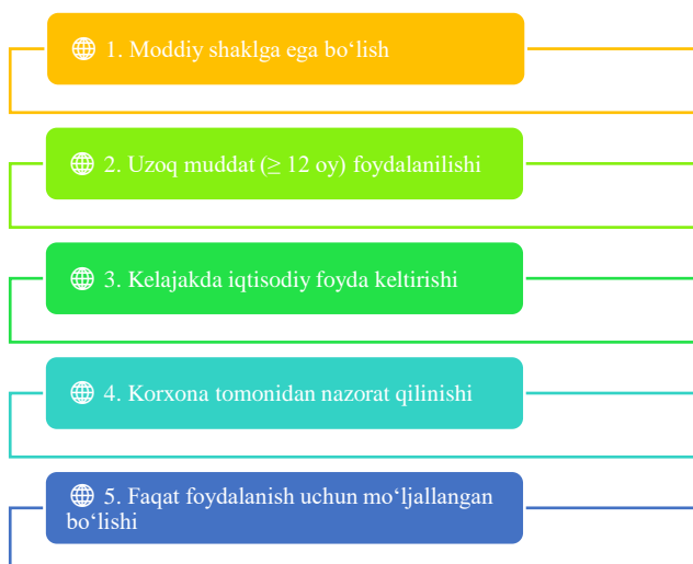
2-rasm. Asosiy vositalarga qo'yilgan talablar 2