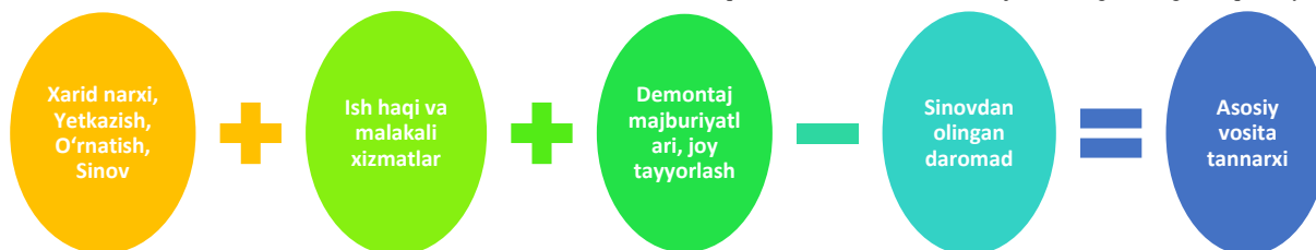
3-rasm. BHXS 16 ga ko'ra asosiy vositalarning tannarxi 1

Asosiy vositalar korxonada faoliyatining moddiy-texnik bazasini tashkil etuvchi muhim iqtisodiy resurslar hisoblanadi. Ularning tarkibi va tuzilmasini to'g'ri aniqlash hamda hisobini samarali yuritish maqsadida asosiy vositalarni turli mezonlar asosida tasniflash zarur hisoblanadi. Bunday tasniflash yondashuvi nafaqat buxgalteriya hisobini to'g'ri tashkil etish, balki moliyaviy tahlilni chuqurlashtirish va boshqaruv qarorlarini asoslashda ham muhim ahamiyat kasb etadi. Xalqaro amaliyotda, xususan BHXS 16 "MulK, bino va uskunalar" talablari asosida, asosiy vositalar ularning iqtisodiy mazmuni, funksional vazifasi, moddiy tarkibi hamda foydalanish xususiyatlariga ko'ra guruhlanadi. Ushbu tasnif asosiy vositalarning korxonada faoliyatidagi o'rnini yanada aniqroq baholash, ularning samaradorligini tahlil qilish va moliyaviy hisobotda to'g'ri aks ettirish imkonini beradi. Shu munosabat bilan asosiy vositalarni quyidagi asosiy mezonlar bo'yicha tasniflash maqsadga muvofiqdir.