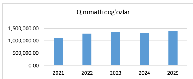
2-rasm. Sug'urta bozorida 2021-2025 yillarda depozitlar dinamikasi 3 Manba: National Agency of Perspective Projects hisobotlari

Bu yerda, ulush ko'rsatkichi: 2024-2025 yillar holatiga ko'ra, sug'urta kompaniyalari jami investitsiyalarining 63% dan 70% gacha bo'lgan qismi bank depozitlariga to'g'ri kelmoqda. O'sish dinamikasi: 2021-yilda depozitlar hajmi 2,2 trln so'm bo'lgan bo'lsa, 2025-yilga kelib bu ko'rsatkich 6 trln so'mdan oshgan. Bu sohaning barqaror va likvidli aktivlarga bo'lgan ehtiyoji oshayotganini ko'rsatmoqda